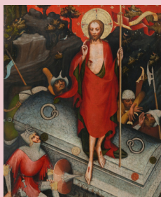
ilustrace: Zmrtvýchvstání Krista

V užším náboženském pojetí se Velikonocemi míní pouze slavnost Zmrtvýchvstání Páně neboli Vzkříšení Krista (Boží hod velikonoční), ke kterému mělo dojít třetího dne po jeho ukřižování. Kristovo ukřižování se událo kolem roku 30 či 33 v blízkosti významného židovského svátku pesach, který je památkou vysvobození Izraelitů Mojžíšem z egyptského otroctví. Tak jako Letnice jsou tedy původně (i podle latinského názvu) svátkem židovským a do roku 325 se slavily ve stejný den jako svátek židovský. Velikonoce jsou pohyblivý svátek, datum se rok od roku mění. V západní křesťanské tradici neděle Zmrtvýchvstání připadá na první neděli po prvním jarním úplňku po rovnodennosti, tedy na měsíc březen či duben. U Slovanů a Germánů splynuly