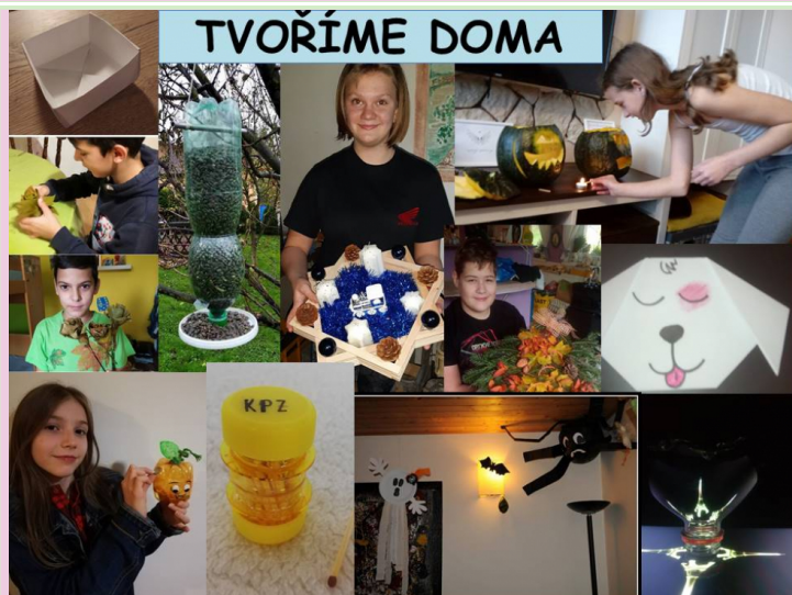
foto: Žáci 6.B a 6.C